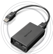
Kabel Lenovo® DisplayPort-DisplayPort und Lenovo® DisplayPort-Dual-DisplayPort