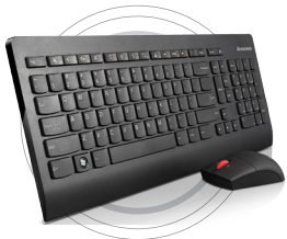
Ultraflache Lenovo® Wireless-Tastatur- und Mauskombination